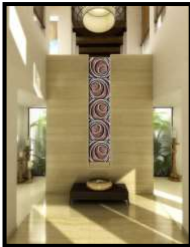
شكل (6) : إضافة جدارية خزفية من تكرار البلاطة مع تغير إتجاهها في منتصف المساحة

بلاطة خزفية بالتشكيل اليدوي ثم الكبس في قالب لعمل نسخ منها، مع إستخدام اللون الأبيض في تلوين الخطوط البارزة ودرجات اللون البني في الاجزاء الغائرة، حيث إعتد التصميم على فكرة تكرار الوحدة الدائرية مع تغير الحجم والإتجاه، وإبراز ذلك عن طريق تأكيد الوحدة بالخطوط البيضاء البارزة.