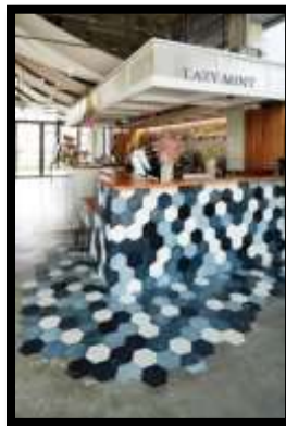
شكل (2) (انترنت/3)

تصميم جدارية خزفية على طاولة إستقبال فندق، تتميز بإستخدام فكرة التكرار لبلاطة خزفية ذات الشكل السداسي واللون الأزرق بدرجاته في إنتشار يمتد إلى الأرضية