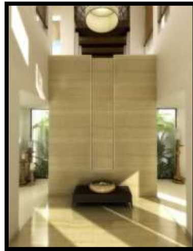
شكل (5) : جدارية من الرخام في مدخل فندق