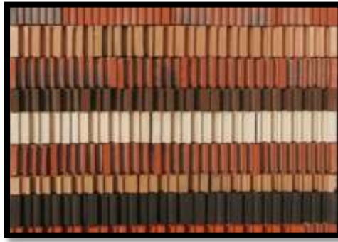
شكل (16) : جدارية من الطوب الملون المرصوص على هيئة صفوف تبعا للشكل واللون