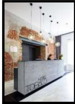
شكل (1) (انترنت/2)

صالة إستقبال فندق في بولندا تم إستخدام جدارية خزفية من الطوب الأحمر في خلفية طاولة الإستقبال، ويتضح جماليات التصميم الداخلي عن طريق التضاد بين تصميم الجدارية الذي يتمتع بالبساطة دون عمل معالجة للسطح وبين تصميم طاولة الإستقبال ذات التصميم الحديث.