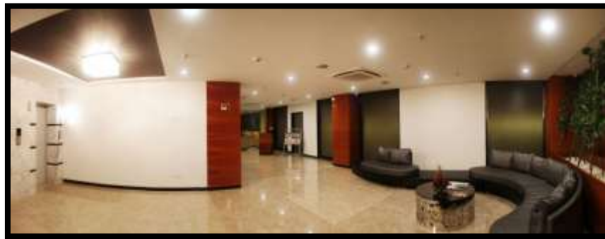
شكل (17) : بهو في أحد الفنادق