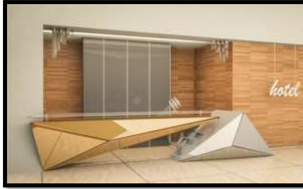
شكل (8) : طاولة إستقبال بتصميم هندسي باللون الذهبي والفضي في صالة إستقبال أحد الفنادق