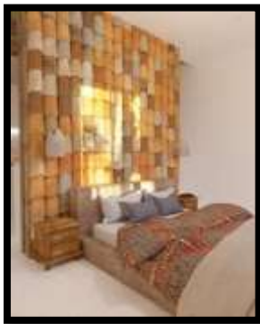
شكل (3)

جدارية خزفية في غرفة نوم بأحد الشقق الفندقية، منفذة بإستخدام قراميد الأسقف وهو من أكثر أنواع الخزف إنتشارا في بلغاريا، ويعتبر تصميم الجدارية الخزفية متوافق مع المفاهيم الخاصة بالتصميم الداخلي لهذه الشقة الفندقية والذي يعبر فيها المصمم عن البساطة والبداية.