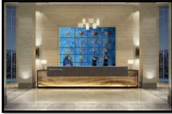
شكل (12) : توظيف للجدارية الخزفية في خلفية طاولة الإستقبال في تناغم لإستخدام اللون الذهبي ودرجات الأزرق الموجود في طبيعة المكان.