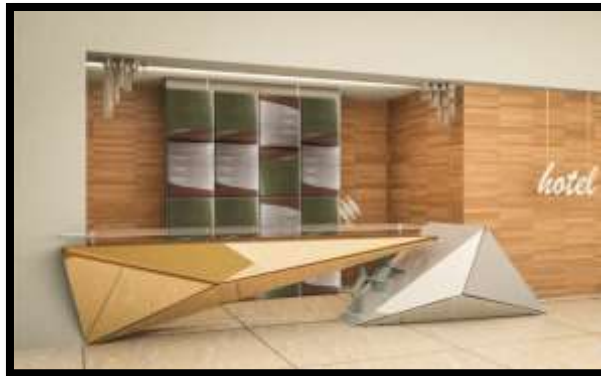
شكل (9) : تصميم الجدارية الخزفية في علاقة تضاد بين حداثة تصميم طاولة الإستقبال وبين ألوان الخزف المأخوذ من الطبيعة في خلفيتها.