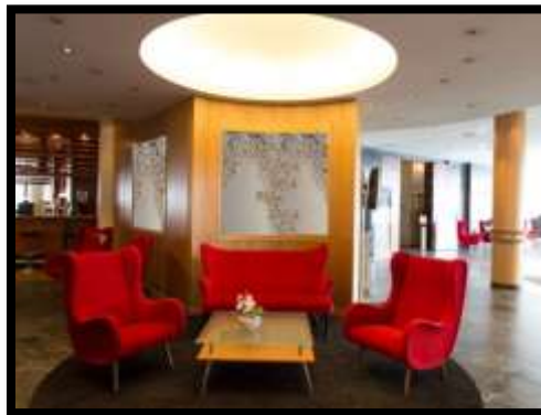
شكل (15) : الإستفادة من الجدارية الخزفية كبديل ذو قيمة تصميمية عن الجداريات الورقية في بهو الفندق.