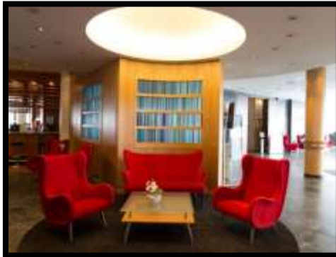
شكل (14) : بهو أحد الفنادق وبه جداريات ورقية مطبوعة