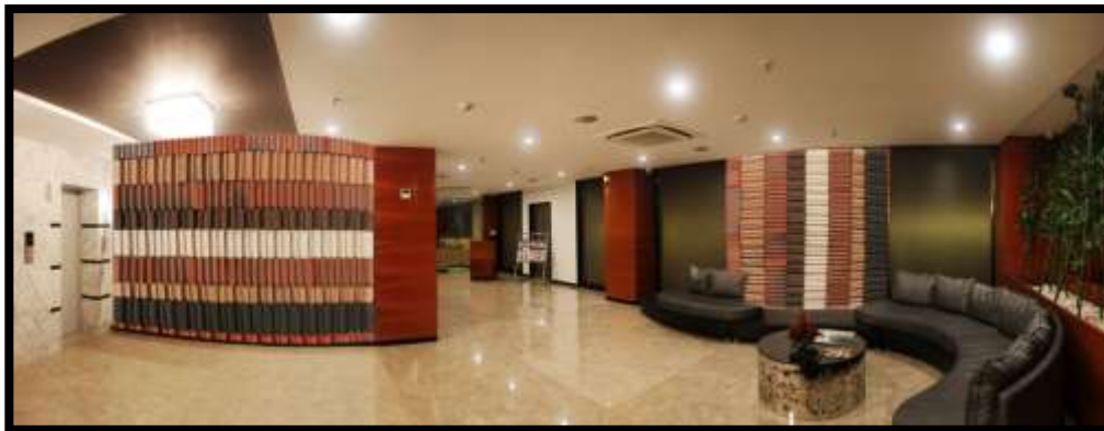
شكل (18) : استخدام جداريات خزفية من الطوب الخزفي الملون بعدة ألوان ( الأبيض، درجات من البني والأحمر والأزرق والأسود) في بهو الفندق في تناسق لوني مع التصميم الداخلي للبهو.