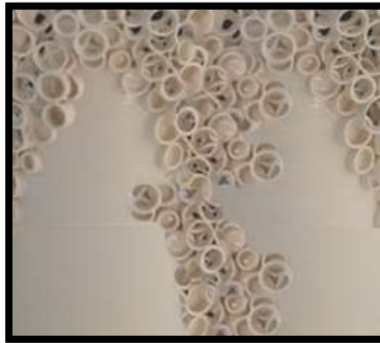
شكل (13) : جدارية خزفية من البورسلين مع تشكيلات على السطح بطريقة التشكيل بالبتق ومطلية بطلاء زجاجي شفاف.