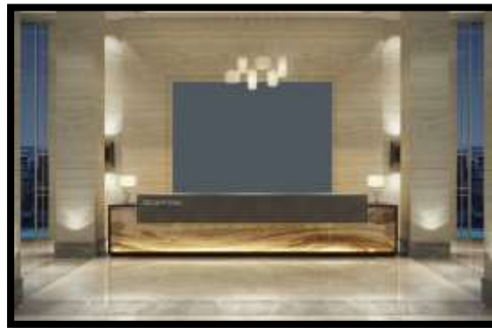
شكل (11) : صالة إستقبال أحد الفنادق